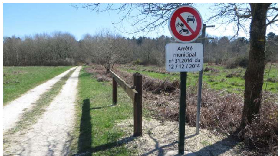
Barrière et panneau installés côté Mortier de Provence

Notre action déterminée a pu empêcher l'aliénation du CR 4, sans pouvoir bloquer l'arrêté municipal qui a suivi. Mais nos courriers et demandes répétés ont permis une clarification de la situation au profit des randonneurs.