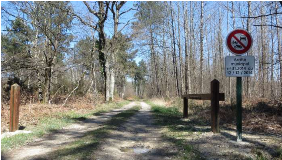
Barrière et panneau installés côté route d'Ingrandes.

Veillons maintenant à ce que les barrières restent ouvertes (et pour cela ne pas hésiter à les remettre à leur place !)